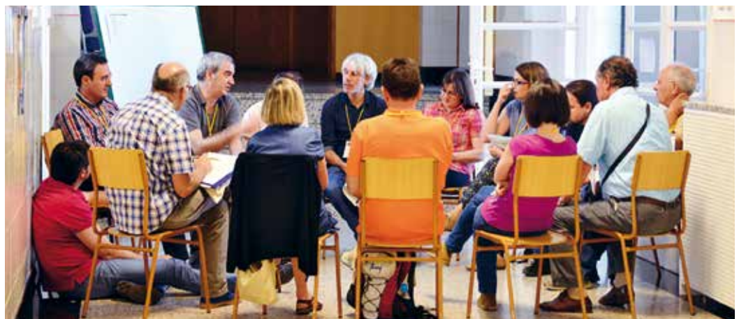
Encuentro de personas socias en Madrid