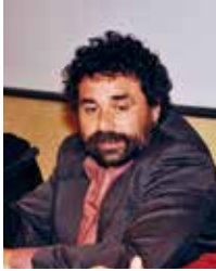
Ugo Biggeri Presidente Banca Etica

En las calles de esa amalgama de edificios de piedra, madera y hierro que es el casco viejo de Bilbao, hay ahora una novedad ya asentada y adaptada al entorno, incluso desde el punto de vista arquitectónico.