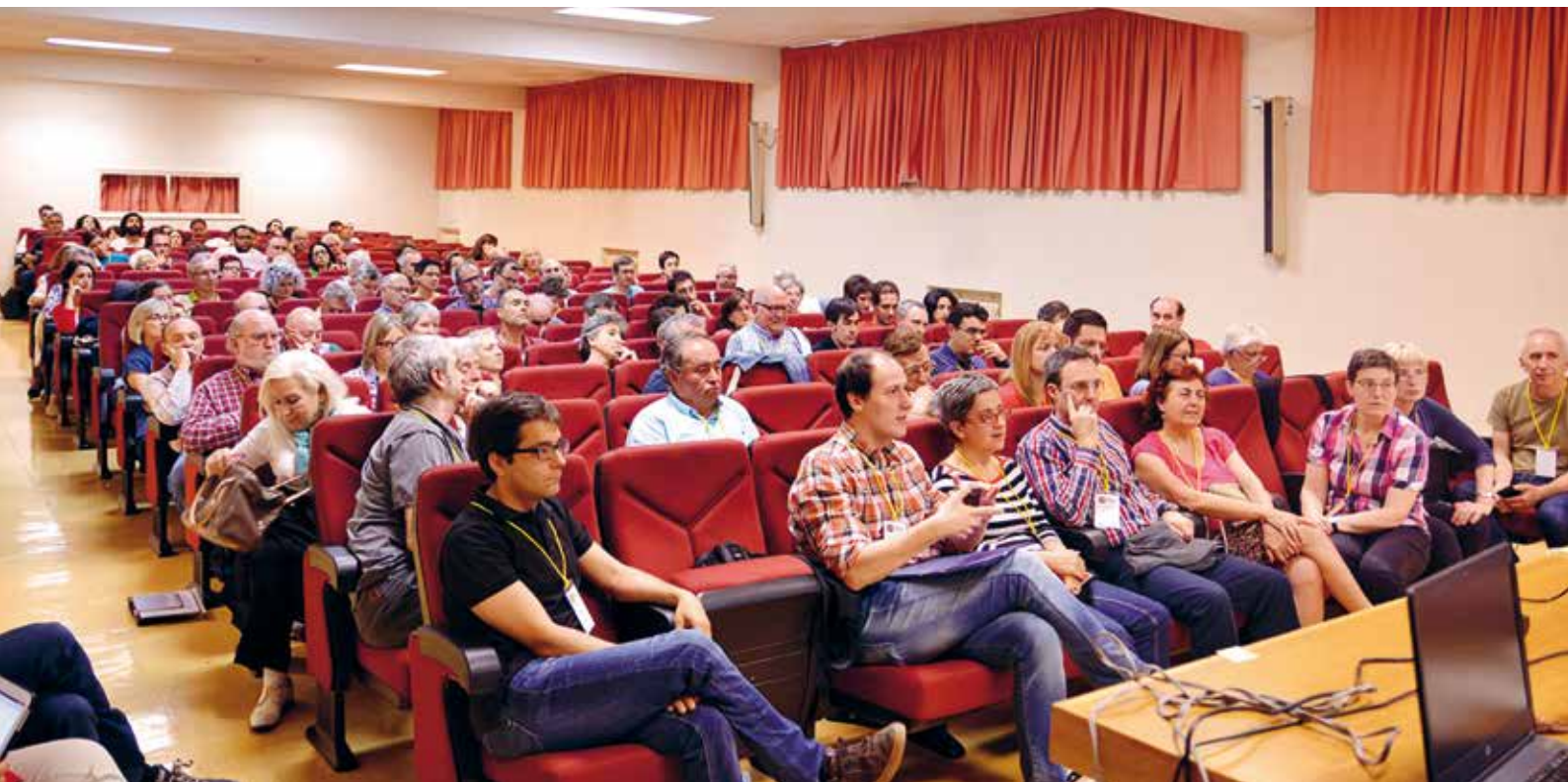
Encuentro de personas socias en Madrid

Porque para Banca Etica... ¡el interés más alto es el interés colectivo!