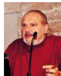
Peru Sasia Consejero del Area Fiare