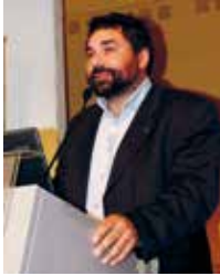
Ugo Biggeri Presidente Banca Etica

Apreciados socios y socias: Estamos a punto de decidir un nuevo modelo de gobierno de Banca Etica.